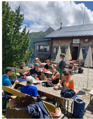
Sonnwendfeier: Familiengruppe vor der Gamshütte