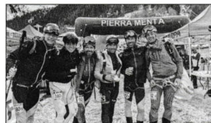
Zielfoto „Pierra Menta“ der drei deutschen Herrenteam