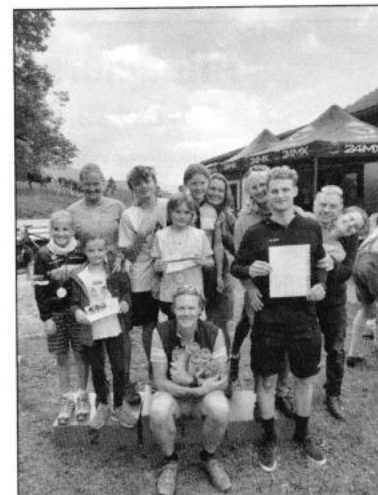
Siegerehrung Familienwertung