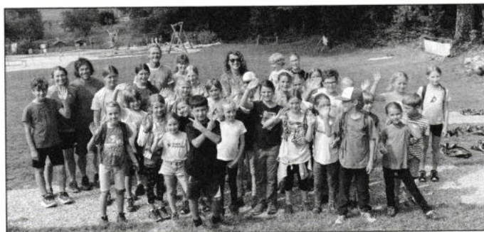
Kletterwald Ostin

Keinen Respekt vor der Höhe hatten kurz vor den Sommerferien 32 Kletterkinder im Kletterwald Ostin. Bei dem gemeinsamen Ausflug der Kindergruppen hatten alle, trotz einer etwas langatmigen Einführung in die für uns Kletterer ziemlich umständliche Sicherungstechnik, viel Spaß bei den Hochseilgarten-Parcours zwischen den Bäumen.