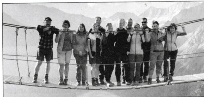
Hängebrücke an der Olpererhütte