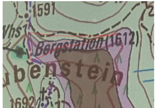
Abbildung 2 Schutzgebietserweiterung Bereich Taubenstein (LRA Miesbach)

Die Feinanpassungen im Bereich des Taubensteins erscheinen aus mehreren Gründen ebenfalls nicht sinnvoll. Den Bereich zwischen Taubensteinbahn und Taubensteinhaus zu sperren ist Skitourengehern nicht zu vermitteln. Als einzige Möglichkeit zum Passieren bliebe das oft abgeblasene, wurzlige, stufige Stück zwischen Taubensteinbahn und Sattel mit einer anschließenden flachen Querung. Dies ist aus Sicht eines Skitourengehers höchst unattraktiv. Die Grenze direkt an den Wanderweg zu legen raten wir ebenfalls ab, weil Abschnitte mit Ski mitunter neben dem Wanderweg besser passierbar sind. Effektiv würde die Schutzgebietsfläche minimal vergrößert, jedoch zu Lasten der Akzeptanz aufgrund einer praxisfernen Regelung. Wir raten daher, die alte und bewährte Regelung zu belassen. Die Erweiterung würde dem Naturschutz keinen Dienst erweisen.