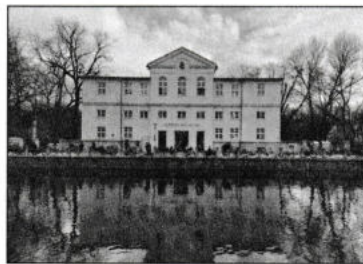
Das Alpine Museum in München

Das Alpine Museum des DAV auf der Praterinsel in München und auch die Bibliothek hat nach mehrjähriger Umbaupause wieder geöffnet. Lust auf Café Isarlust? Das Team vom Museum, darunter übrigens auch meine Frau Carmen, freut sich auf Euren Besuch.