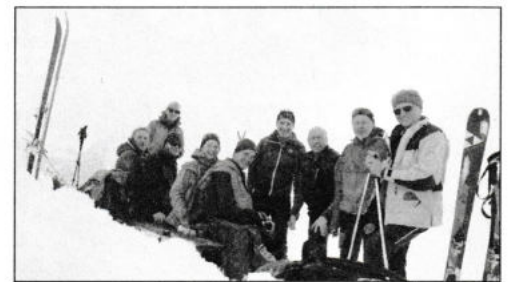
Sektionsgruppe auf der Ultenspitze

Anfang März war eine 10 köpfige Sektion Gruppe unter der Leitung von Julia Riedl in den Brenner Bergen unterwegs. Mit von der Partie auch