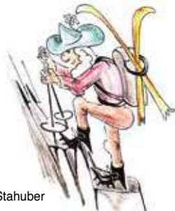
Text u. Zeichnung: Bernd Stahuber

Die folgende Liste bietet eine Übersicht welcher Leiter welchen Termin plant und organisiert, bei Interesse bitte direkt Kontakt aufnehmen.