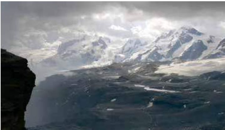
Blick auf den Piz Palü, Bernina