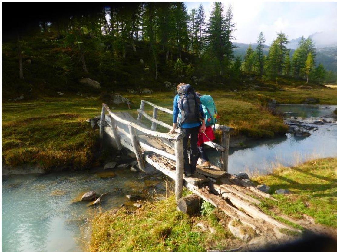
Eine „vertrauenserweckende“ Brücke Richtung Lago Nero

Es zieht zu! An der Passhöhe stehen wir im Nebel und dann regnet es sich langsam ein. Das ist jammerschade, denn dieser Übergang zum Passo di Valtendra ist wohl einer der rasantesten Abschnitte in diesem Teil des GTA. Man quert auf schmalen, teilweise seilversicherten Pfaden über steile Gras-