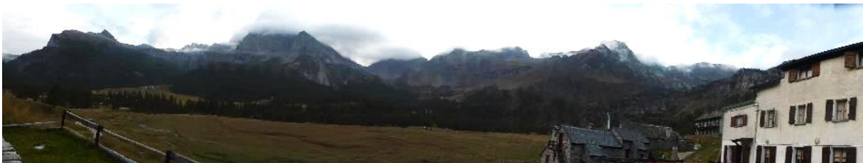
Die Alpe Veglia mit dem nebelverhüllten Gipfel des Monte Leone