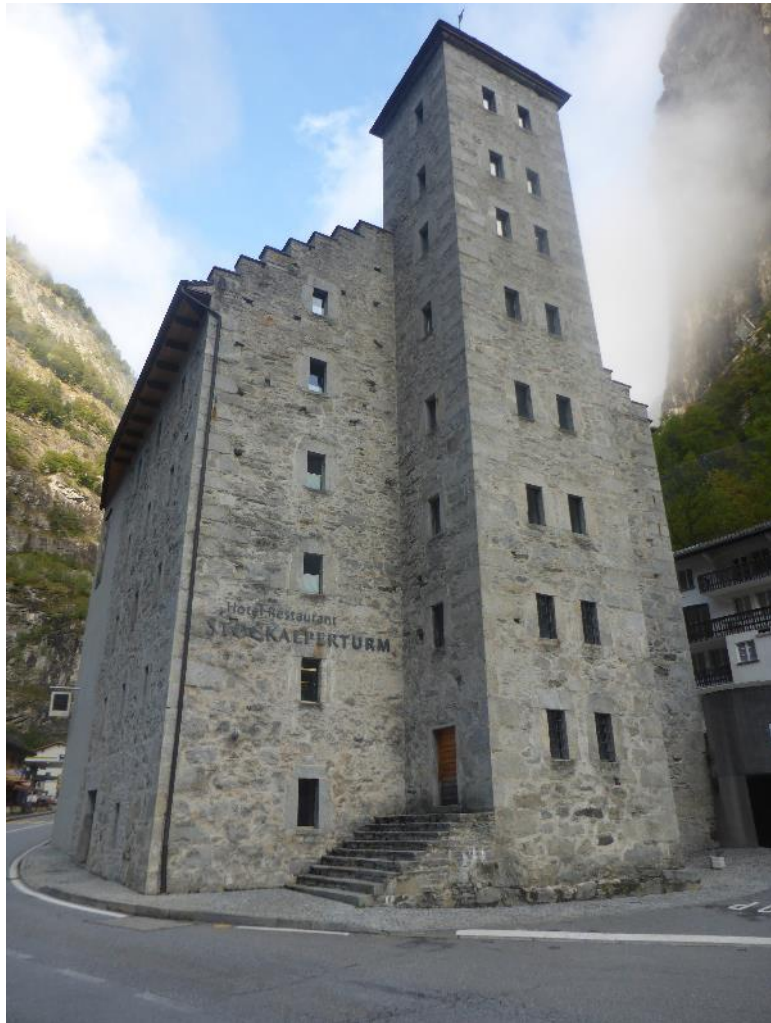
Hotel Stockalperturm in der Gondoschlucht

Tag 6: Gondo – Rifugio San Bernardo. Die Herbergsuche wird schwieriger. Hier haben wir nicht mehr vorgebucht und erfahren, dass die meisten Hütten wegen Corona und der späten Jahreszeit schon geschlossen haben. Nur das Rifugio San Bernardo oberhalb von San Lorenzo ist offen. Der Aufstieg beginnt im Tal von Zwischbergen, das wir wieder mit dem Bus erreichen. Nachdem das Wetter immer unsicherer wird, beschließen wir den kurzen Weg über den Passo Monscera zu nehmen und den schönen Tschawiner See auszulassen. Das Wetter ist dann aber gar nicht so schlecht, teilweise scheint sogar die Sonne. Am malerisch gelegenen Lago Ragozza sind wir fast versucht in das Wasser zu hüpfen, aber das moorige Ufer und das sich wieder verschlechternde Wetter bringen uns auf andere Gedanken. Nach einer guten halben Stunde erreichen wir das Rifugio San Bernardo, das dankenswerter Weise wirklich offen hat.