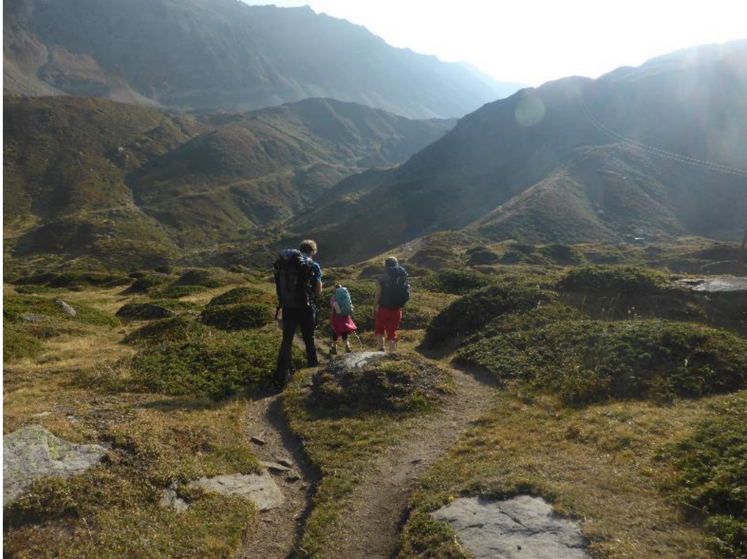
Start bei der Alpe Cruina am Nufenenpass

laufen nach der langen Zugfahrt. Die Hütte hat ein eigenwilliges Design. Das „umgekehrte“ Dach erinnert eher an eine Seilbahnstation, aber der Gastraum ist rundum verglast und sehr freundlich und hell. Die nette Hüttenwirtin mit ihrer Belegschaft begrüßt uns und weist uns ein Viererzimmer zu.