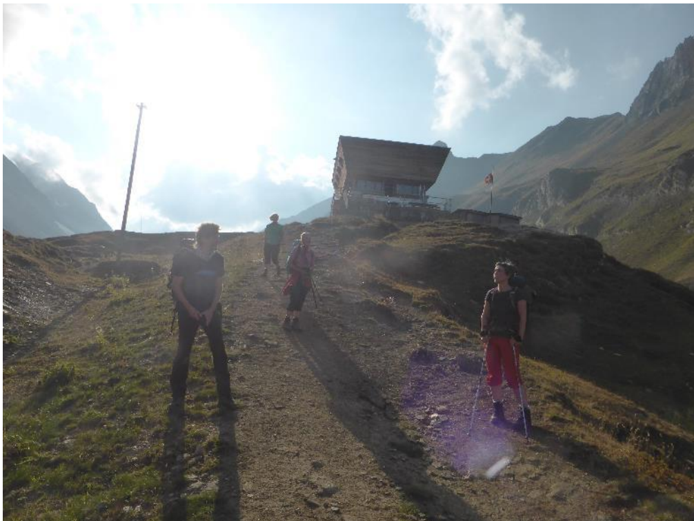
Moderne Architektur der Capanna Corno Gries