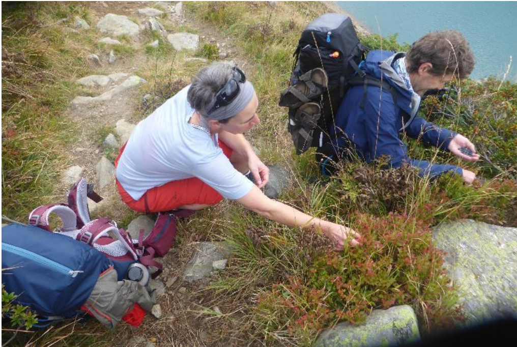
Zusatznahrung am Wegrand

Tag 3: Gemütlich Aufstehen, Frühstück, Aufbruch um 8.00 zur Alpe Devero: 500 m Aufstieg, 1000 m Abstieg, 5 Stunden – moderat. Aber das Wetter ist neblig. Ich hatte mir vorgenommen keinen Proviant für mehrere Tage mitzunehmen und deshalb beim Wirt zwei Paninis bestellt. Die zwei erweisen sich als Einpfünder, sie sollten die nächsten drei Tage reichen. Der Weg führt hinter dem Lago Vanino vorbei zum Bivacco Ettore Conti, mit 2600 m dem höchsten Punkt des GTA. Kurz hinter dem See tauchen aber unerwartete Hindernisse auf – Blaubeeren. Sie verzögern den Aufstieg mindestens eine Stunde. Der Weg führt beschaulich durch hochalpine Matten mit kleinen Bachläufen und einigen Mooren. Nur diese Blaubeeren wollten nicht aufhören. Irgendwann geben wir uns geschlagen, wir können nicht alle essen!