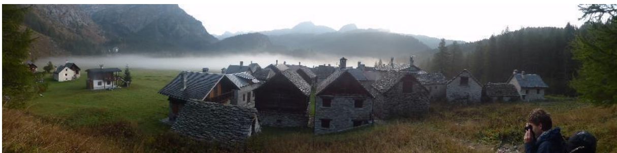
Alpe Devero im Morgennebel

Tag 4: Morgens Nebelschwaden dazwischen Sonnenschein. Heute sehen wir das weitläufige Panorama und einige Gipfel, die am Vortag verschleiert waren. Richtung Südwesten erstreckt sich eine weitere Hochebene die Alpe Buscagna über die man in einer gemütliche Wanderung den Sattel Scatta d’Organa auf 2436 m erreicht. Der Abstecher zum Lago Nero erweist sich als weniger lohnend als versprochen. Er ist halbleer und mitten im Wald. Bemerkenswert ist allenfalls, dass es diesmal kein Stausee ist.