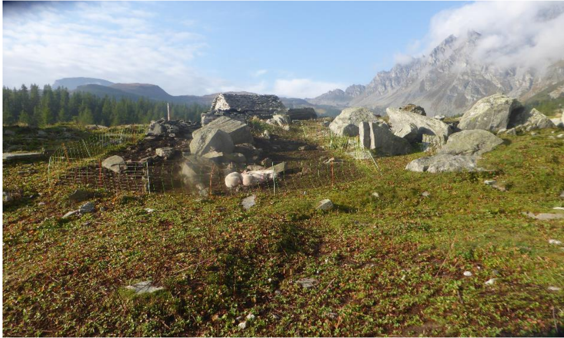
Alpe Buscagna noch im Sonnenschein