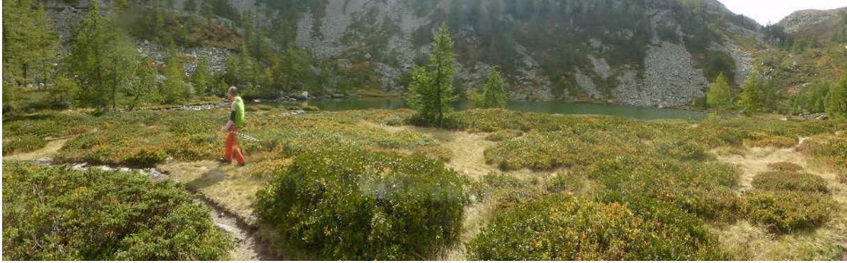
Lago di Ragozza

Tag 7: Der Wetterbericht hat Dauerregen mit Schnee bis in tiefere Lagen vorhergesagt. Zudem wissen wir, dass die beiden Hütten auf der nächsten Etappe zur Alpe Cheggio geschlossen sind. Der Führer sagt, diese Passage sollte unbedingt nur bei trockenem Wetter angegangen werden, da im letzten Teil sehr steile Wiesen zu queren sind, die in den Lago dei Cavalli abstürzen. Wir hatten am Vortag gesagt: „Schaun mir mal, ob es wirklich so schlecht wird“ und einige Fluchtrouten ausgekundschaftet. Beim Frühstück ist es noch trocken, aber als wir die Rucksäcke packen legt es schon los. Damit ist klar: das wird nichts mehr, denn diese Etappe kann man auch nicht einfach umgehen und es war ohnehin die vorletzte. Das bleibt dann dem kommenden Jahr vorbehalten, denn dass wir diese Tour fortsetzen wollten, darüber waren wir uns einig.