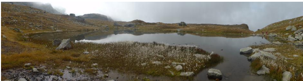
Wollgrasplantagen unter dem Bivacco Ettore Conti

Am Pass ist es ungastlich neblig, kalt und windig. Nach kurzem Abstieg erreichen wir einen kleinen moorigen Talboden mit großflächigen Wollgrasplantagen. Außerdem kommt die Sonne durch den Nebel – Fototermin! Die Landschaft wird danach weit. Man erreicht eine riesige Hochebene mit schönen anschließenden Hängen zu den Gipfeln – das ideale Schitourenengelände! Aber es ist erst September und wir haben nur unsere Wanderschuhe. Außerdem hat das DAV-Panorama kürzlich Schitouren bei der Alpe Devero ausschweifend angepriesen. Vergessen wir es, es ist sowieso Corona!