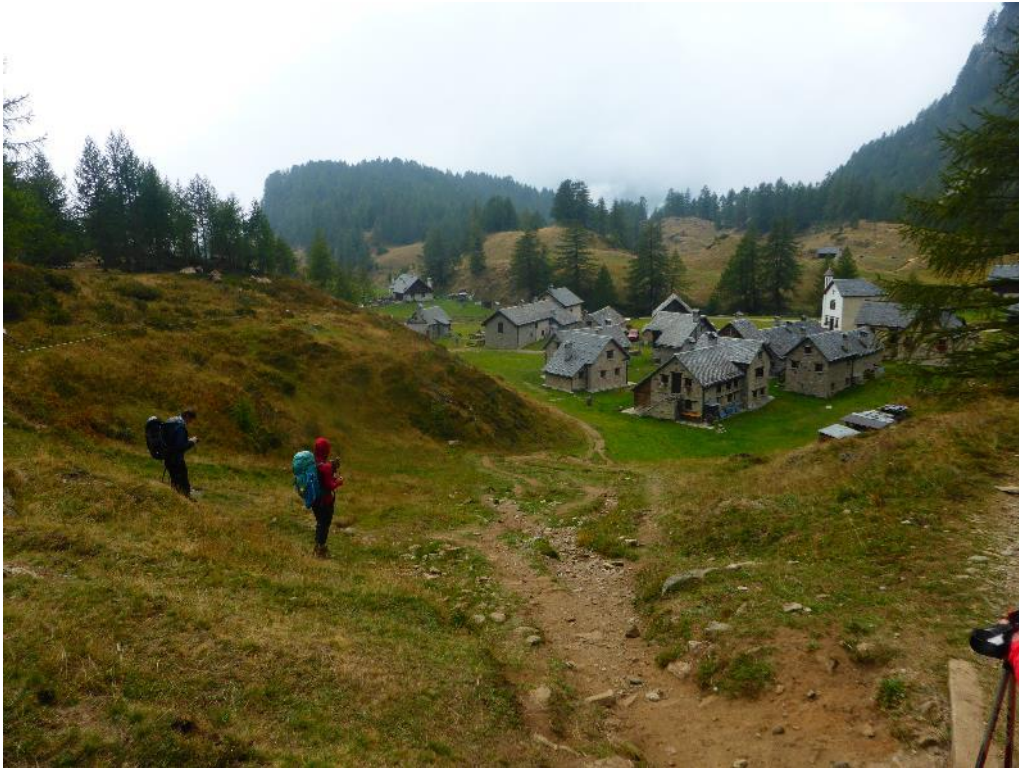
Zum Touristenort umgebaut: Crampiolo

Wasser endlich. So warm ist es mittlerweile auch nicht mehr, aber zum Eintauchen im Wasser reicht es doch noch. Bevor wir die Alpe Devero erreichen bekommen wir im Touristenweiler Crampiolo auch unseren Käse und den ersten richtigen Regenschauer. Wir versuchen ihn bei Capuccino auszutricksen aber er erwischt uns trotzdem noch. Der Regenschirm kommt zu seinem ersten Einsatz.