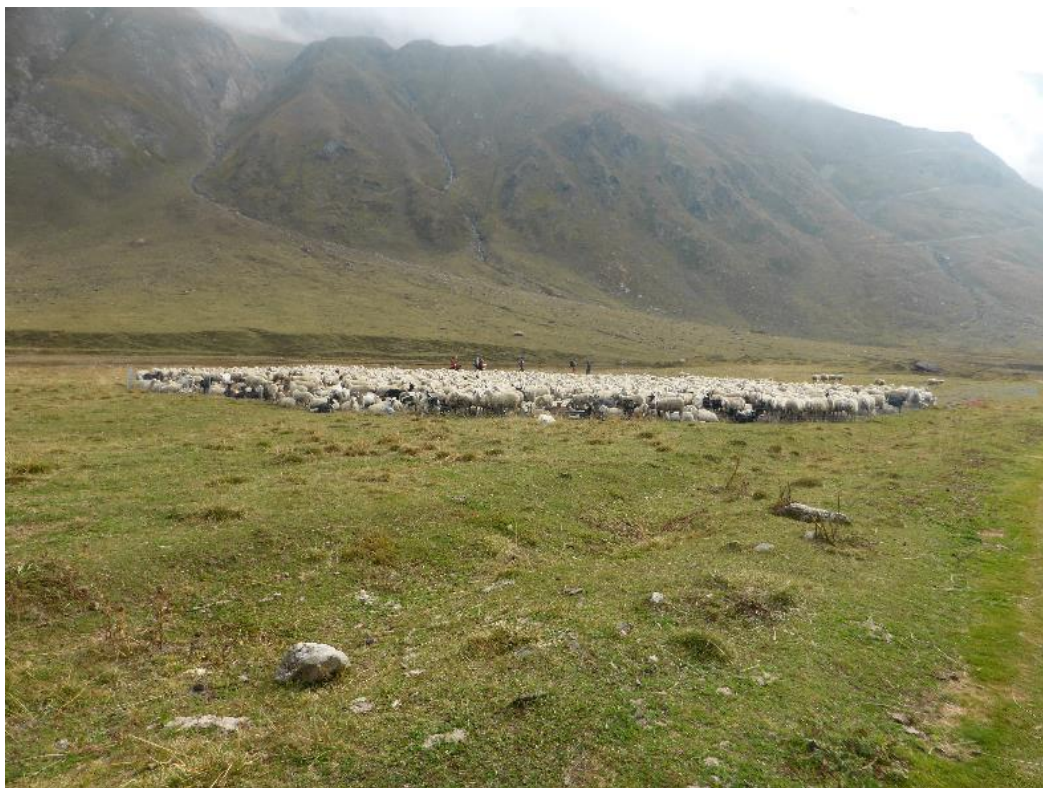
Almabtrieb auf der Alpe Bettelmatt

Wir starten am 2. Tag gegen acht nach einem gemütlichen Frühstück Richtung Rifugio Margaroli: 1000 m Aufstieg, 1100 m Abstieg, fünfeinhalb Stunden sagt der Führer. Dass es bei diesen Wanderungen morgens nicht eilt, hebt sie angenehm von anderweitigen alpinen Unternehmungen ab. Das Wetter zeigt sich noch freundlich. Noch, denn der Wetterbericht war nicht sehr vielversprechend gewesen. Im Süden hatte sich ein Tief eingensitet, das seine Ausläufer immer wieder nach Norden bis zum Hauptkamm entsandte während bei uns zuhause der ungetrübte blaue Himmel prangte. Aber da gibt es keinen GTA. Nun, das freundliche Wetter reichte noch eine knappe Stunde. Kurz hinter dem Griespass, einem ehemals wichtigen Handelsübergang stehen wir dann im dichten Nebel. Die Gedenktafel für Richard Wagener, der am 18. Juli 1852 hier vorbeigekommen war können wir gerade noch erkennen aber der Ausblick auf die Gletscher des Blinnenhorns hat den Vorhang zugezogen. Immerhin regnet es nicht und weiter unten lichtet sich auch den Nebel wieder. Die Alpe Bettelmatt liegt unter uns. Sie ist berühmt für den gleichnamigen Käse. Zu kaufen gibt es leider nichts, denn die Senner sind bereits mit dem Abtrieb der Schafe beschäftigt und versuchen die Muttertiere mit den Lämmern von der restlichen Herde zu trennen.